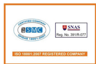
OHSAS 18001: 2007 İş Sağlığı ve Güvenliği Yönetim Sistemi