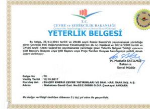
Çevre Danışmanlık Yeterlik Belgesi (ÇED)