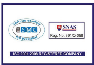
ISO 9001:2008 Kalite Yönetim Sistemi Belgesi