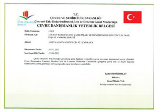
Çevre Danışmanlık Yeterlik Belgesi