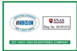
ISO 14001:2004 Çevre Yönetim Sistemi