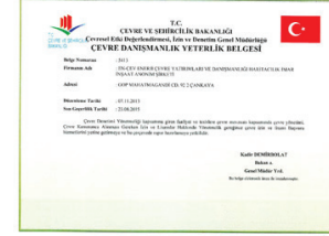
Çevre Danışmanlık Yeterlik Belgesi