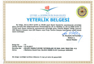
Çevre Danışmanlık Yeterlik Belgesi (ÇED)